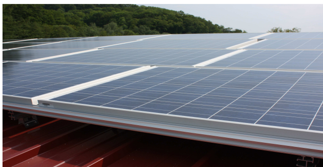
Unsere neue Photovoltaikanlage